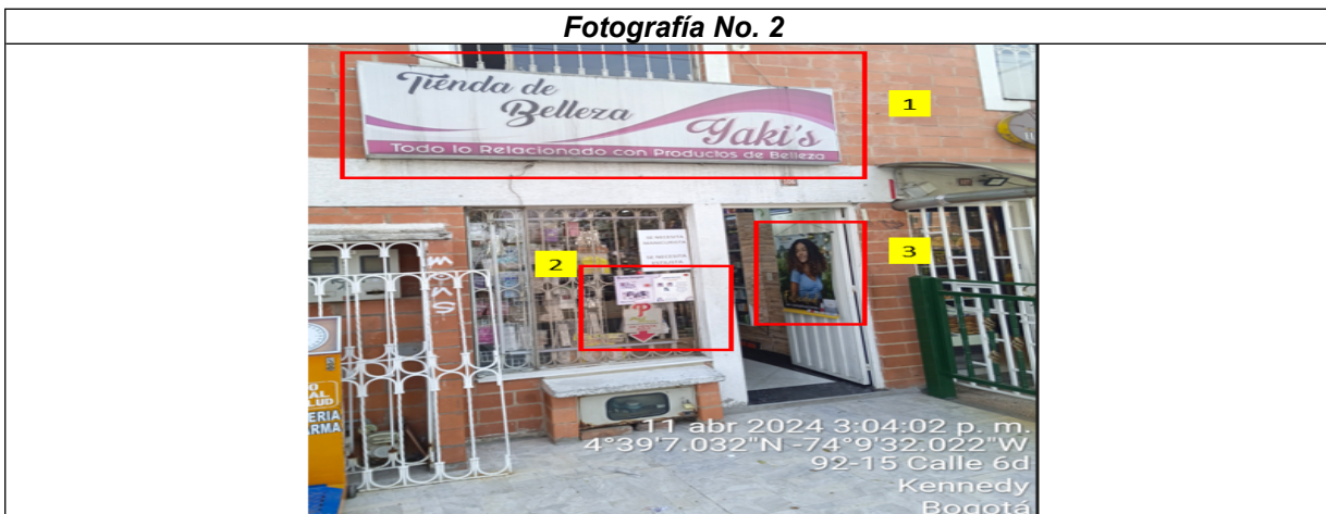
Fotografía No. 2

En la cual se evidencia la fachada del establecimiento comercial “DISTRIBUIDORA DE BELLEZA YAKIS”, en la que se observan: tres (3) elementos publicitarios, identificado con el número 1, el cual en la visita técnica manifestaron que contaba con registro; sin embargo el registro se encuentra adjudicado a la CR 94 No. 6 C - 30 LC 34 de la localidad de Kennedy, por lo anterior se concluye que el aviso no cuenta con registro, finalmente se muestran los elementos publicitarios identificados con los números 2 y 3 los cuales se encuentran pintados o incorporados a las ventanas y puertas de la edificación